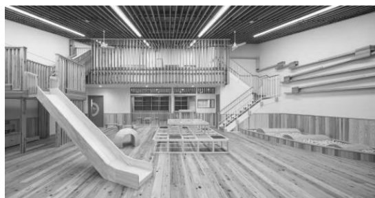
図4 木のアスレチック