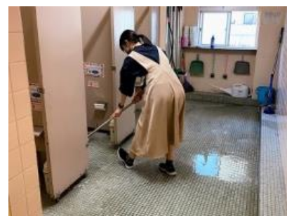
放課後の清掃・除菌の様子