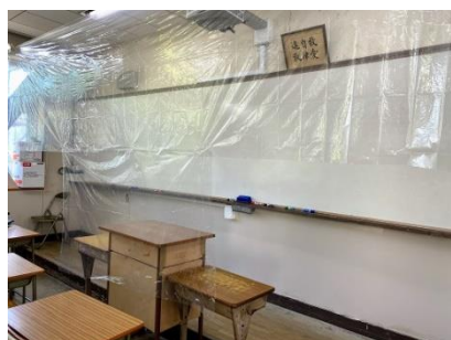
教壇前の透明フィルム