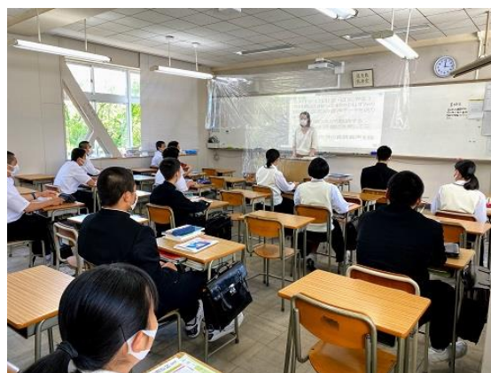
分散登校中の授業の様子