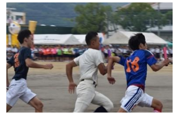
部活動対抗リレー