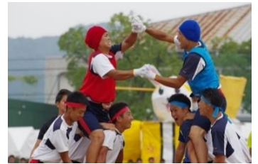
男の戦い Part II