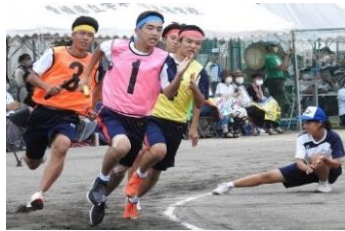
クラス対抗リレー