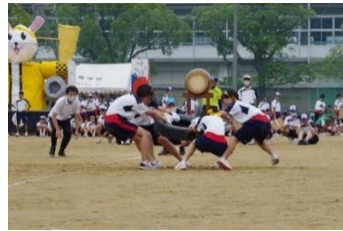
女の戦い Part II