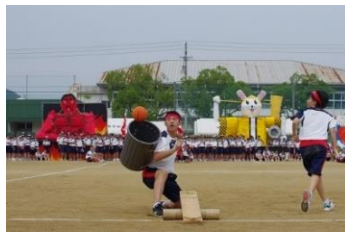
ナイス・キャッチ