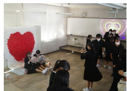
フォトブース（生徒会）