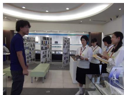
写真1 インタビューの様子